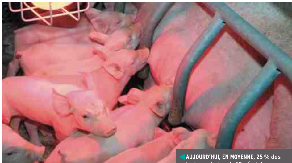
◀ AUJOURD'HUI, EN MOYENNE, 25 % des truies ont plus de 18 nés totaux.

Avec sa nouvelle gamme Nutritec, Vitalac entend réussir le pari d'améliorer à la fois le nombre de porcelets nés, leur poids de naissance et leur vigueur.