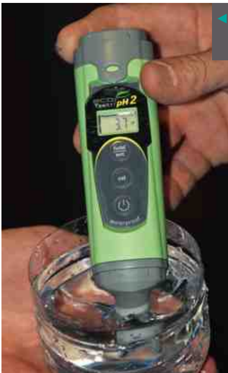
LA PRISE DE pH DANS L'EAU RÉGULIÈREMENT permet de vérifier le bon dosage de l'acide.